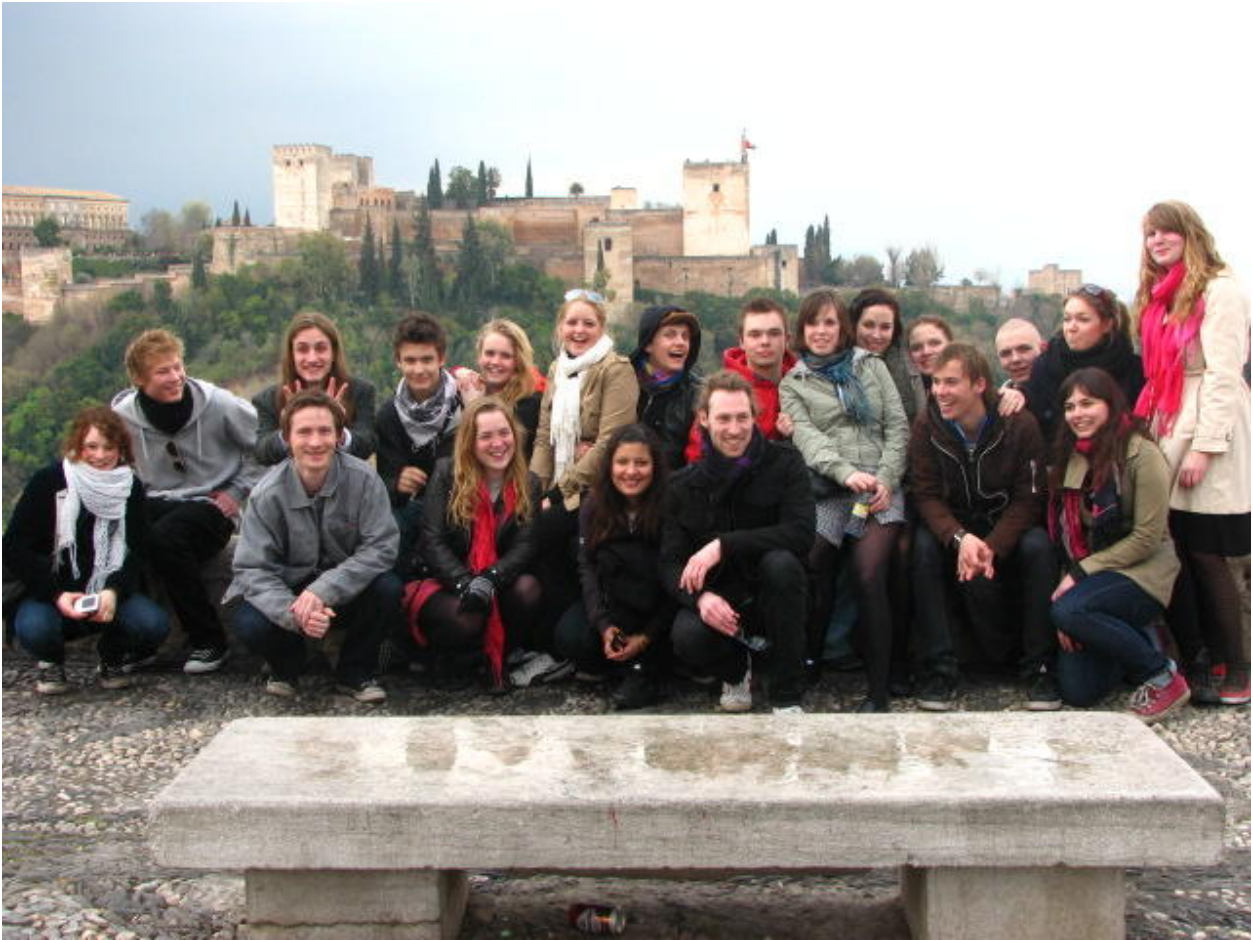
2.b. sammen i Granada med det arabiske middelalderslot Alhambra (en af Spaniens største turistattraktioner) i baggrunden.